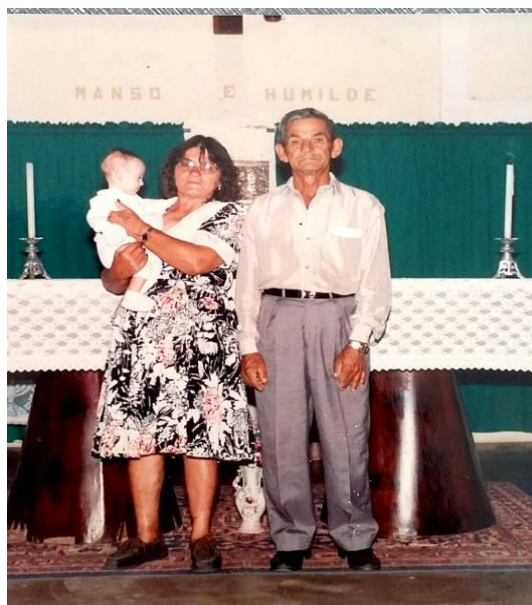
Imagem 8 – Registro feito no altar da Igreja depois da cerimônia