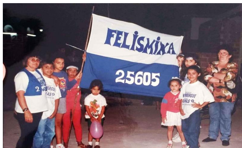
Imagem 18 - Campanha política, Montadas, 1996