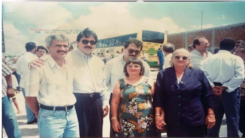
Imagem 3 - Encontro político na cidade de Esperança