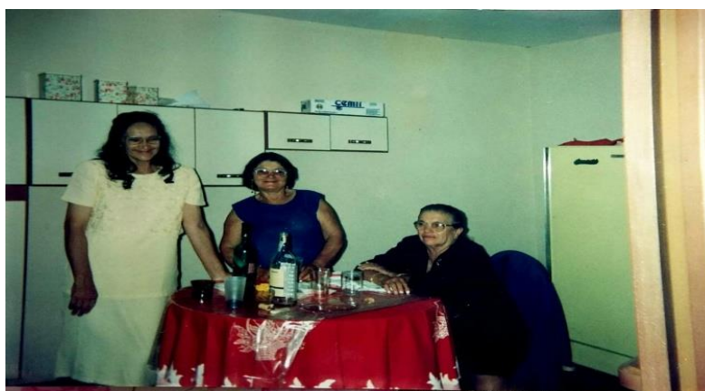
Imagem 6 – Encontro das amigas