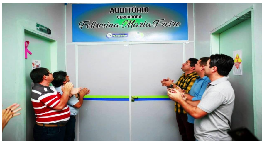
Imagem 20 – Inauguração do Auditório da Saúde, Montadas, 2019