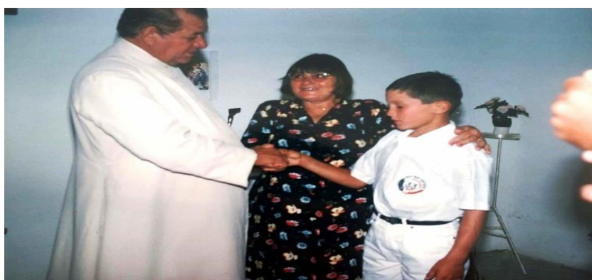
Imagem 12 - Registro pós-batismo, na Igreja São José, em Montadas