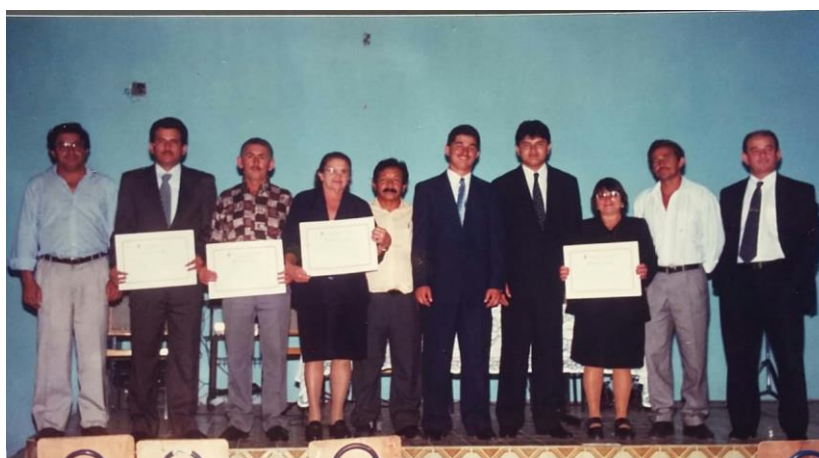
Imagem 1 - Cerimônia de posse, Montadas, 1997