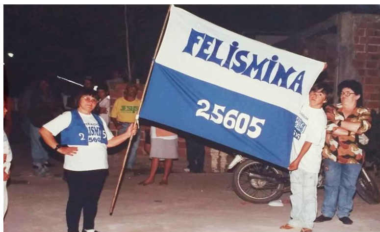
Imagem 17 - Campanha política, Montadas, 1996