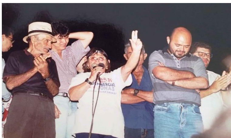
Imagem 16 - Campanha política, Montadas, 1996